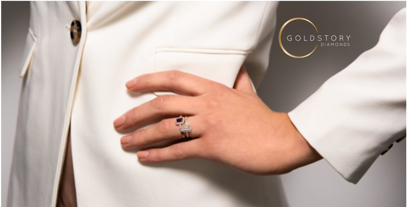
400066 0,05 ct WSI1