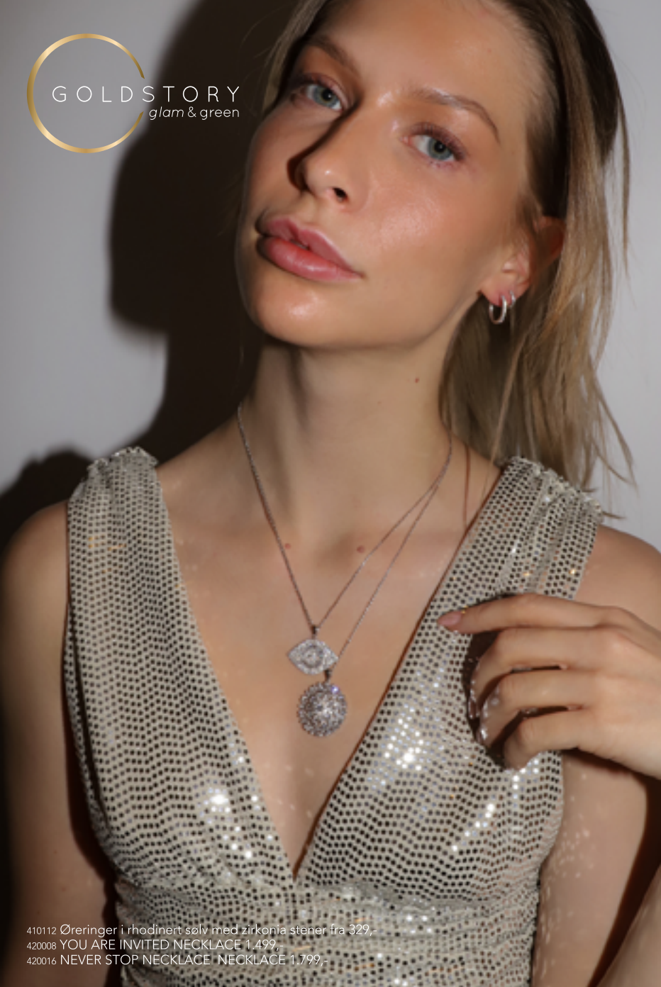
410112 Øreringer i rhodinert sølv med zirkonia stener fra 329,- 420008 YOU ARE INVITED NECKLACE 1.499,- 420016 NEVER STOP NECKLACE NECKLACE 1.799,-