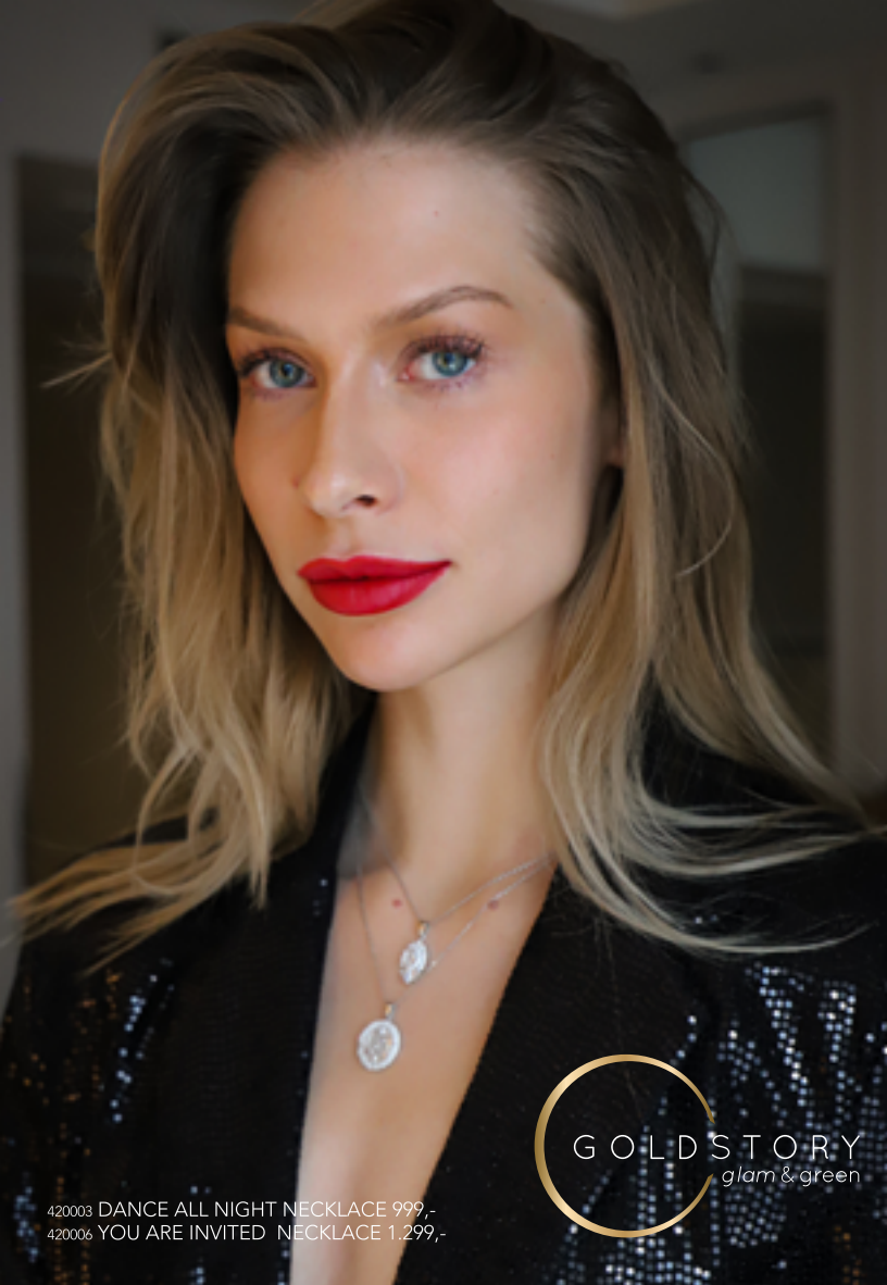
420003 DANCE ALL NIGHT NECKLACE 999,- 420006 YOU ARE INVITED NECKLACE 1.299,-