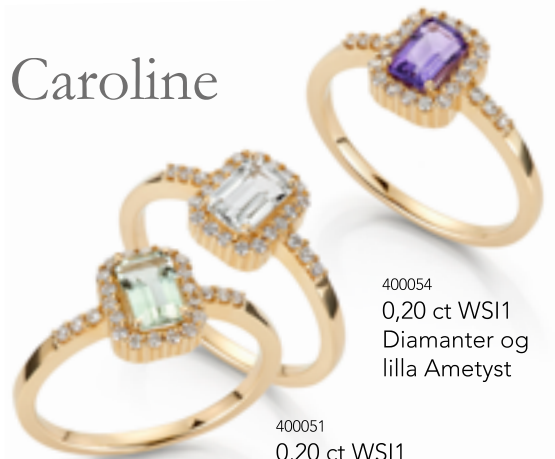
400054 0,20 ct WSI1 Diamanter og lilla Ametyst