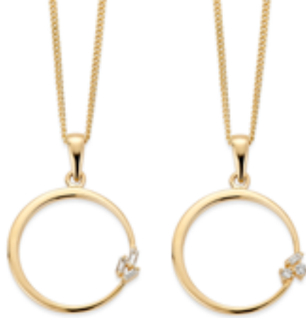
400065 0,05 ct WSI1

Anhengene leveres med 42 cm kjede i forgylt sølv.