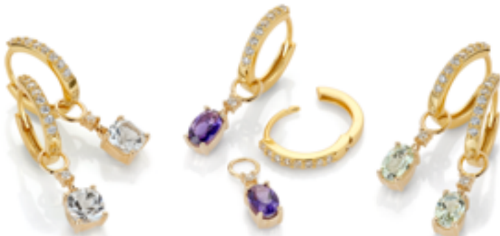
400061 0,03 ct WSI1 Heng med Diamanter og hvit Topas