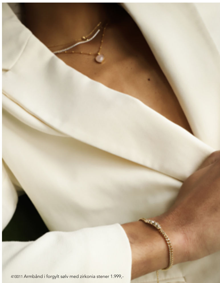
410011 Armbånd i forgylt sølv med zirkonia stener 1.999,-